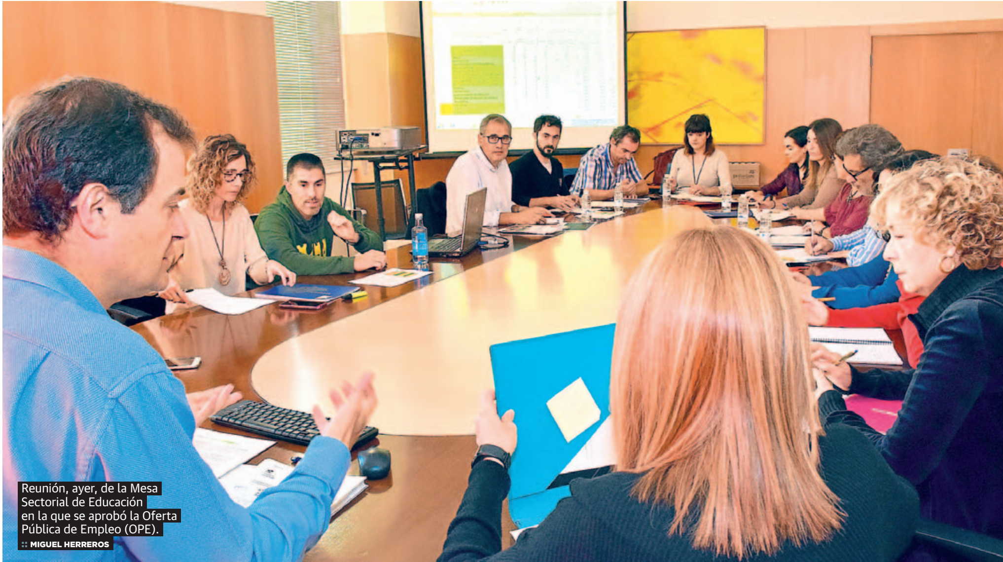
Reunión, ayer, de la Mesa Sectorial de Educación en la que se aprobó la Oferta Pública de Empleo (OPE).