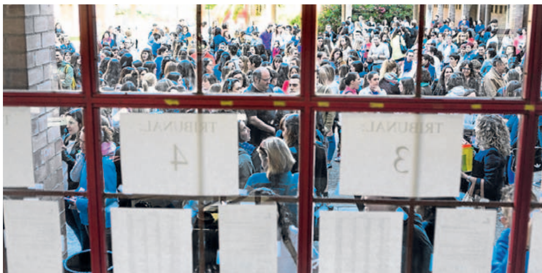
Un grupo de opositores, a las puertas del IES Cosme García, antes de enfrentarse a los exámenes de Educación Primaria, en junio del 2016.